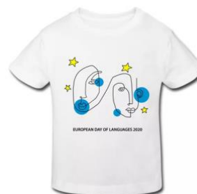
Zmagovalna slika oblikovanja majic 2020 Cataline Maríae Puebla Coenen, Španija.